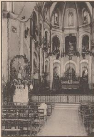
Intérieur Chapelle latérale (Église de Jeanne d'Arc)