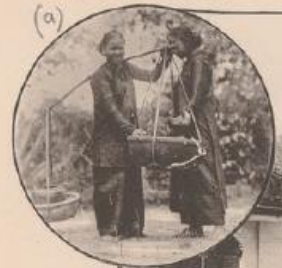
Congai venant du Marche