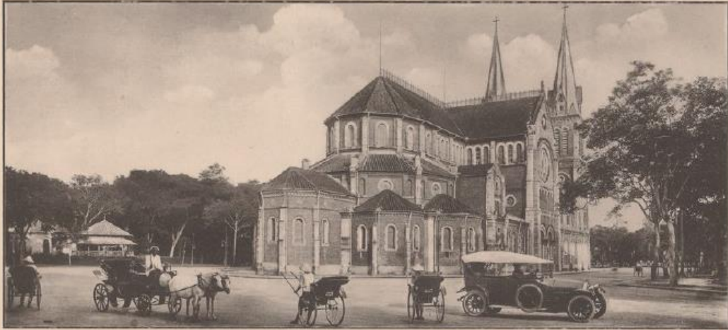
SAIGON. - La Cathédrale (Vue du Boulevard Nocard)