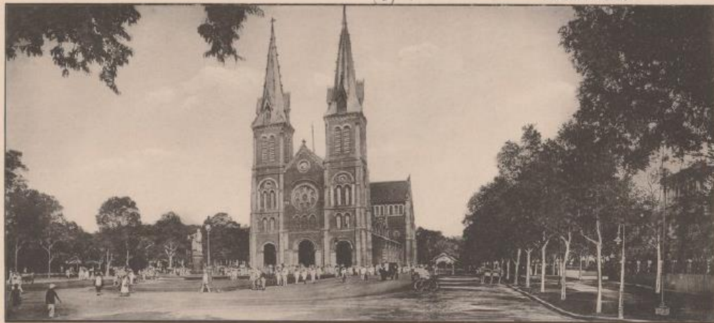
SAIGON. - La Cathédrale - Soirée de la Messe