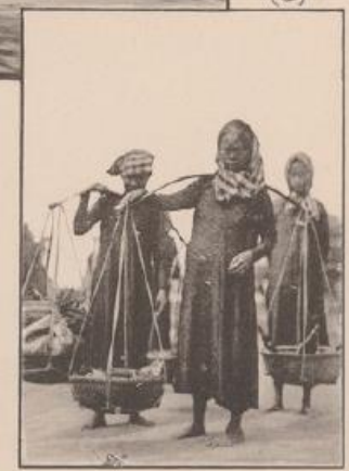
Types de Congai à Saigon