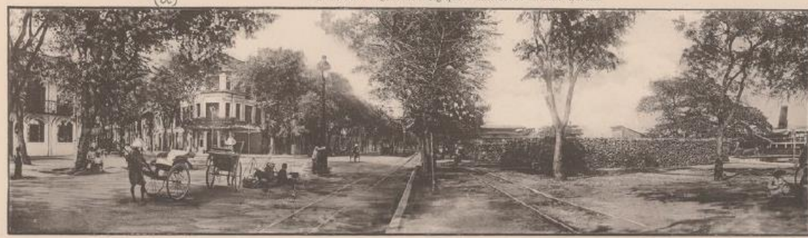
Quai de Belgique - Messageries Fluviales