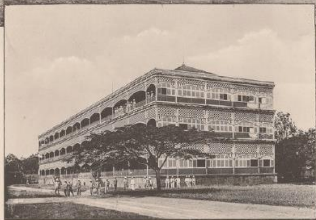
(b) Caserne de l'Infanterie Coloniale