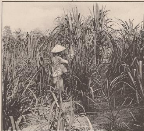
Plantation de Cannes à Sucre (Environ de Saigon)