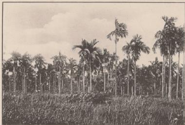
(d) Plantation d'Acéquier