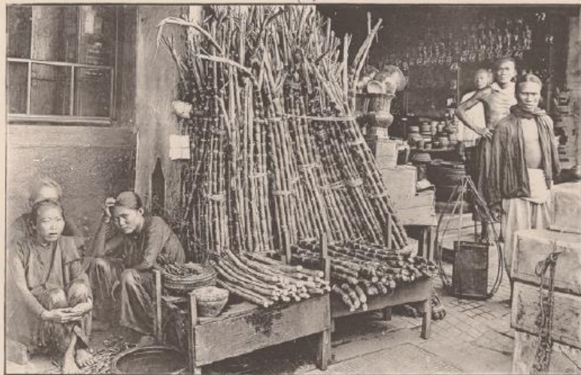
Marchand de Cannes à Sucre