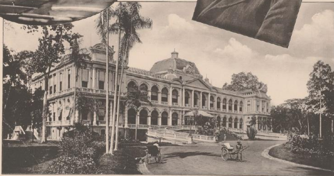
SAIGON. - Palais du Gouvernement général