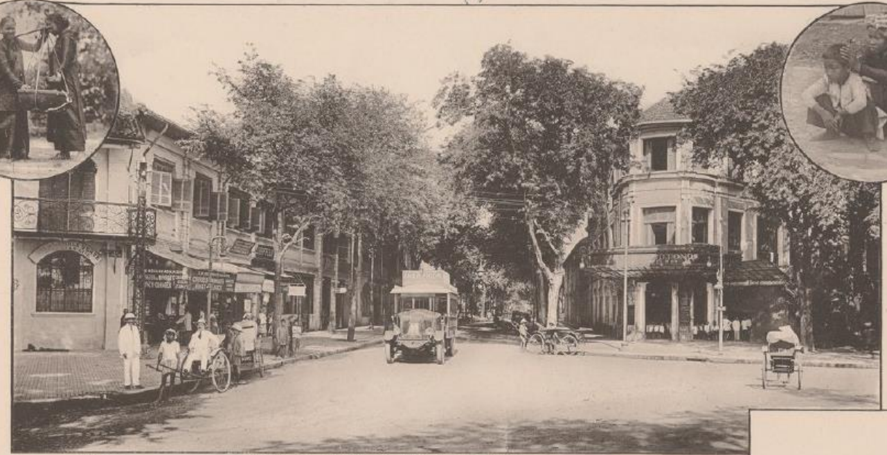
(d) SAIGON. - Quai de Belgique - Entrée de la Rue Catnat