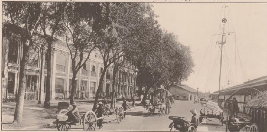
Entrepôts de la Douane (Mât des Signaux)