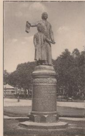
SAIGON. - Statue de P. PIGNATELLI DE BEIANE (Place de la Cathédrale)