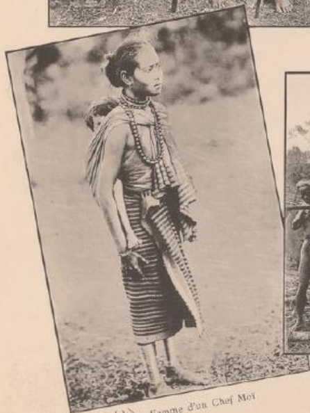
(d) Femme d'un Chef Moi