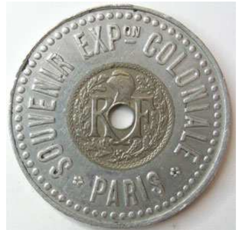
EXPOSITION COLONIALE DE PARIS 1931, Médaille/Jeton souvenir