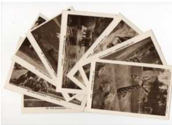
Série de 8 cartes postales anciennes du Parc Zoologique de la collection Exposition Coloniale Internationale - Paris 1931 Braun & Cie