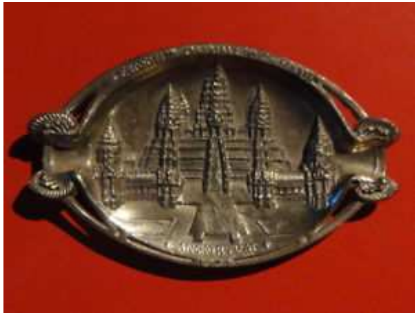
chandrier souvenir de l'exposition coloniale internationale de 1931