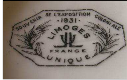
Tasse et sous-tasse de LIMOGES, en souvenir de l'exposition coloniale de 1931