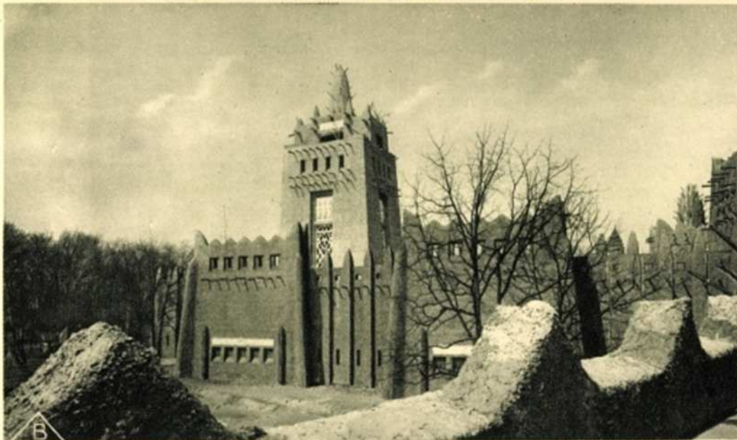
190 PALAIS DE L'A. O. F. — LE PALAIS VU DE LA TERRASSE SUPÉRIEURE DU RESTAURANT DE L'A. O. F.

EXPOSITION COLONIALE INTERNATIONALE — PARIS 1931