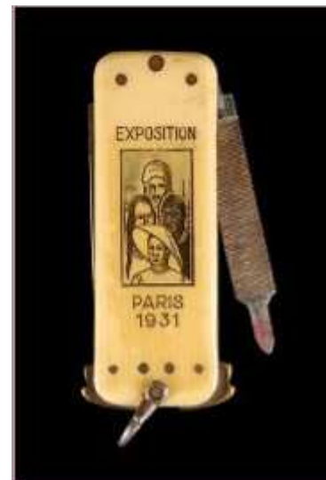
Canif "souvenir" de l'exposition coloniale de 1931 à Paris avec une reproduction de l'affiche de l'exposition coloniale.