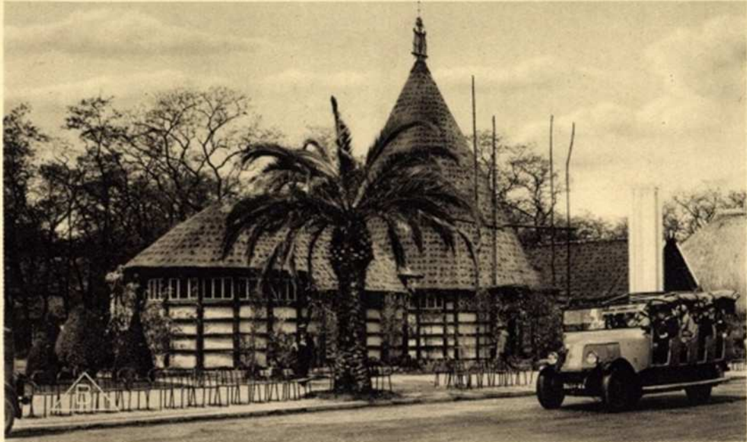
260 PAVILLON DE LA NOUVELLE-CALÉDONIE

EXPOSITION COLONIALE INTERNATIONALE — PARIS 1931