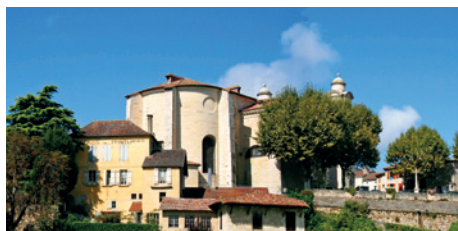
Un patrimoine objet de toutes les attentions