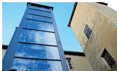
Ascenseur du centre Haussmann