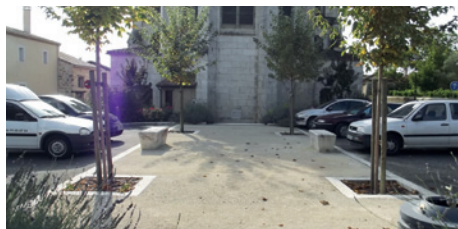
Aménagement de la Place Saint-Marc