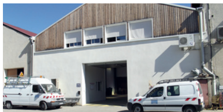
Les ateliers municipaux rénovés après l'incendie