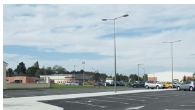
La zone de santé du Pin pour favoriser la présence médicale à Nérac, aujourd'hui remplie