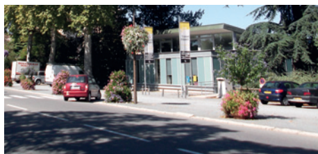
Le Parking de la médiathèque goudronné en 2011