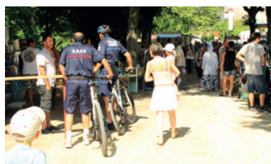
La police municipale à vélo pour plus de proximité