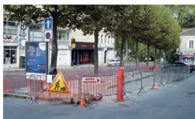
Aménagement de la Place Yves Bétuing en 2013