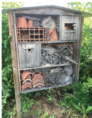
L'hôtel à insectes de Plaisance