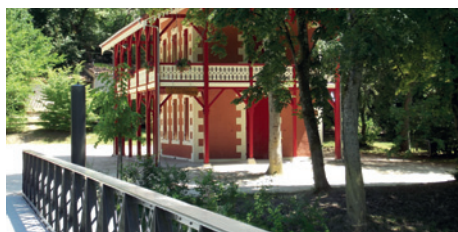
La passerelle neuve et le Chalet rénové