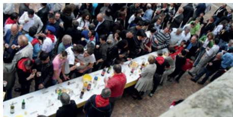
Succès populaire pour l'ouverture des fêtes de Nérac