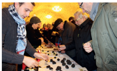
Le charme du marché aux truffes en janvier