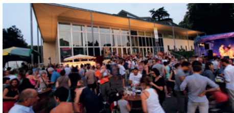
Le plaisir de se retrouver au marché « Mardi So Gascogne » depuis 2008