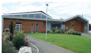
Piscine couverte, un succès populaire