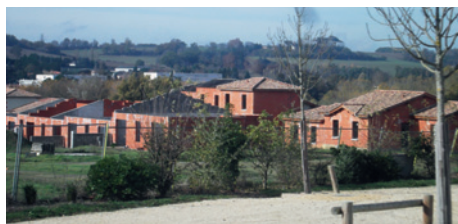
Les logements inachevés de Bourdilot repris par Habitatys