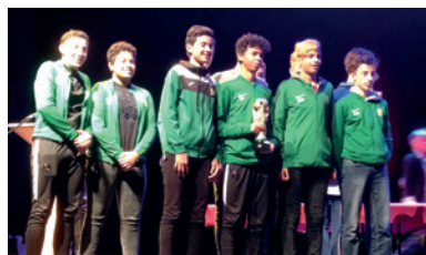
Soirée de récompenses des sportifs néracais