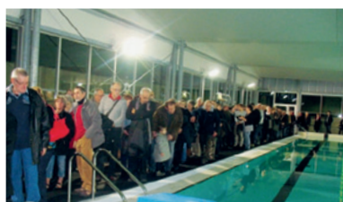
Les Néracais nombreux lors de l'inauguration de la piscine