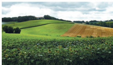
Une agriculture qui protège nos paysages