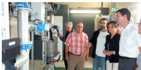
La station de filtration de l'eau de Guillery rénovée