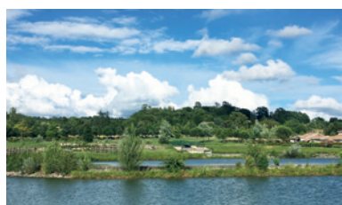
Se promener à Plaisance autour des bassins