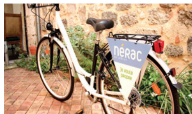
Les économies de carburant dans les services... grâce au vélo