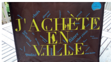
Accompagner le dynamisme de notre commerce et de notre artisanat