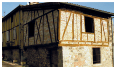
Le chantier école des Tanneries - L'insertion par le travail