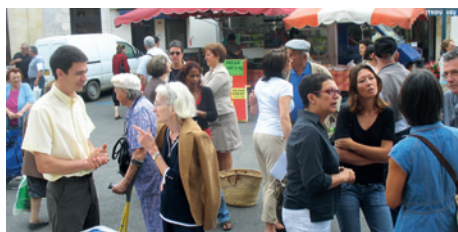
La permanence mensuelle des élus au marché (ici en 2008)