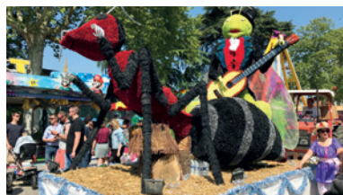
Fêtes de mai : une tradition néracaise