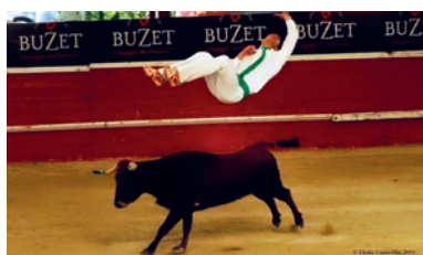
La course landaise, tradition taurine à Nérac