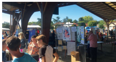
Le forum des associations début septembre