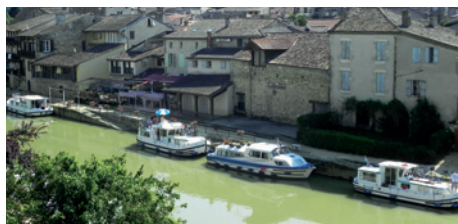
La navigation fluviale, pilier du tourisme à Nérac