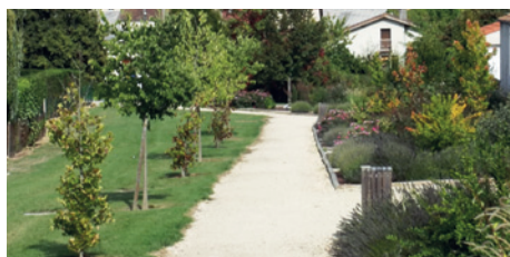
Création de la coulée verte au Couloumé