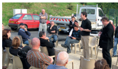
Une des 70 réunions de quartier