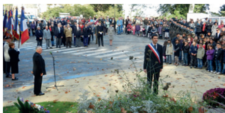
Le devoir de mémoire