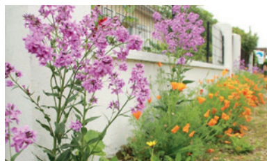
Le Zéro Phyto : imaginons nos trottoirs !