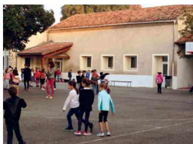
Des écoles équipées et entretenues