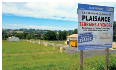
Lotissement Plaisance : devenez propriétaire !