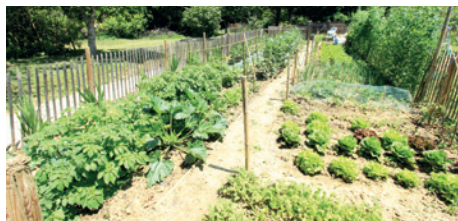
Beau succès pour les jardins familiaux