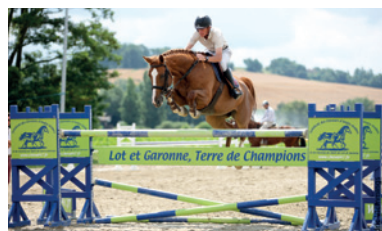
Soutien aux journées de l'élevage