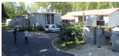
La station d'épuration reprise en régie pour plus d'économies et d'efficacité