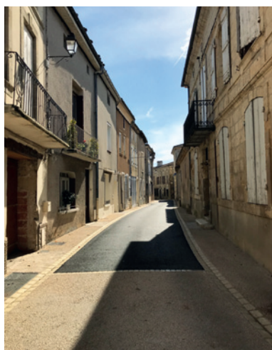
La rue Gambetta rénovée en 2018