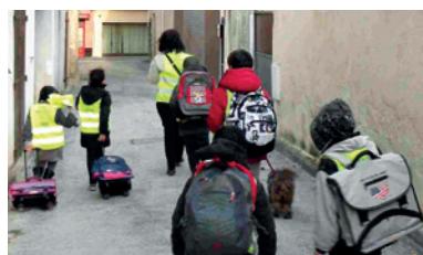
Le Car à pattes pour la sécurité de nos enfants