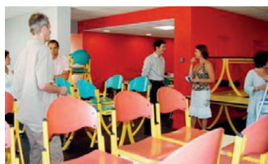
Dernière visite du self-service avant ouverture