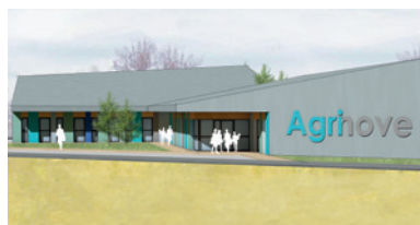
La pépinière d'entreprises : ouverture à l'été 2019