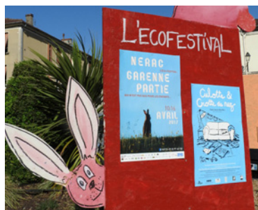
La Garenne Partie : le festival néracais