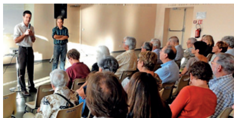
Réunion publique pour présenter le Secteur Sauvegardé