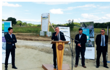
Agrinove : pose de la première pierre en septembre 2018