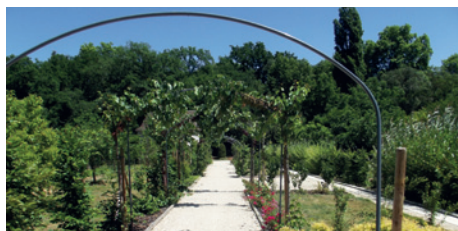
Le jardin Renaissance