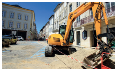
17 rues avec des canalisations neuves