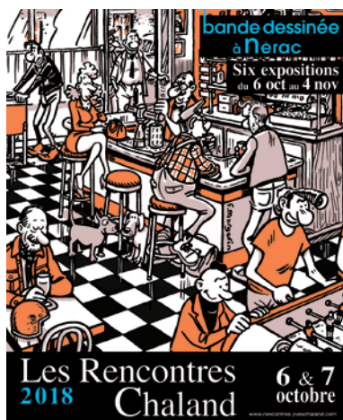
Les Rencontres Chaland depuis 2008 : BD à Nérac