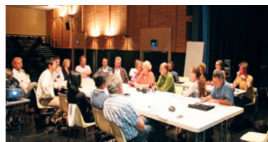
Réunion de concertation dans le cadre de l'Agenda 21