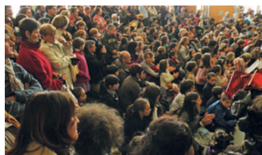
Les Néracais nombreux à l'ouverture de la première Garenne Partie en 2012