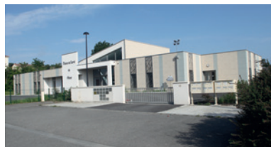
La maison de santé ouverte en 2017