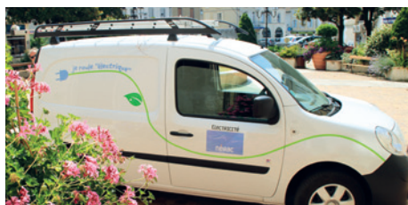
120 agents municipaux à votre service