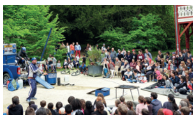
Le parc de la Garenne, objet de toutes les attentions