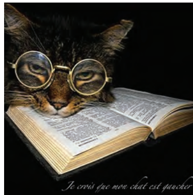
Je crois que mon chat est gaucher - © Cie bob'arts