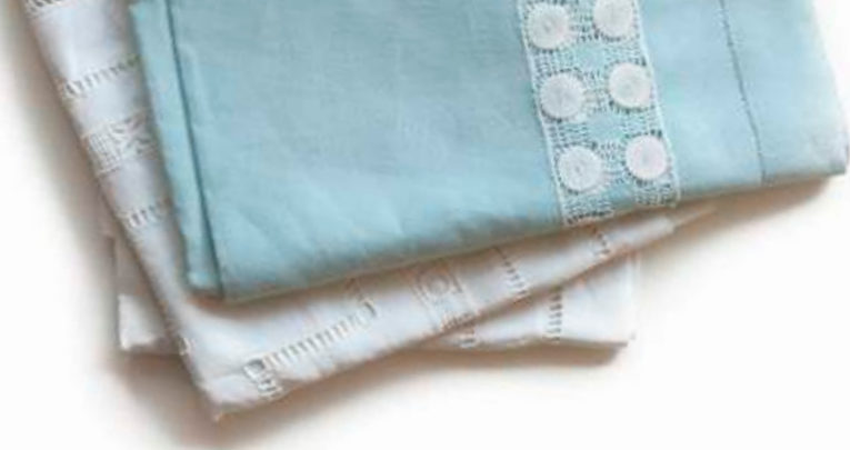
ALICE TOUVET costume

Il va construire les contrôles de certaines marionnettes et en particulier ceux de la Belle.