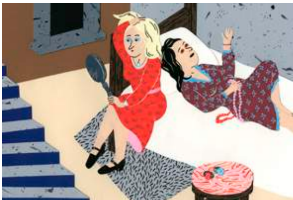
GÉRALDINE ALIBEU illustration