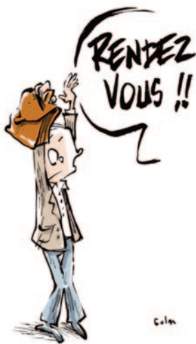
RENDEZ-VOUS DE CARRIÈRE

“ Aujourd'hui, j'ai reçu l'appréciation finale de l'IA-DASEN : « Satisfaisant » alors que ma note d'inspection est de 18/20 et que dans le tableau il y avait coché (4 satisfaisants – 6 très satisfaisants et 1 excellent) et que l'appréciation de l'IEN était très bonne. Sur quels critères s'est-elle arrêtée ?