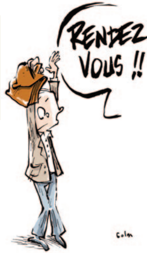
RENDEZ-VOUS DE CARRIÈRE

“ Aujourd'hui, j'ai reçu l'appréciation finale de l'IA-DASEN : « Satisfaisant » alors que ma note d'inspection est de 18/20 et que dans le tableau il y avait coché (4 satisfaisants – 6 très satisfaisants et 1 excellent) et que l'appréciation de l'IEN était très bonne. Sur quels critères s'est-elle arrêtée ?