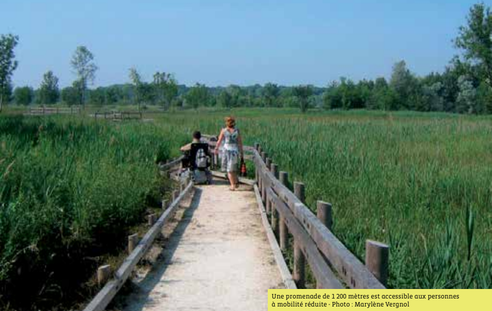
Une promenade de 1 200 mètres est accessible aux personnes à mobilité réduite