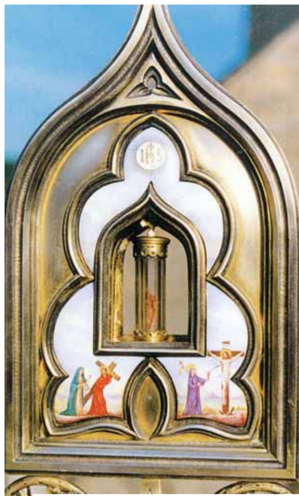
Ostensoir contenant la relique du prodige

Pendant la messe de Pâques 1331, au moment de la communion, un fragment d'hostie tomba sur la nappe. Le prêtre voulut la récupérer, mais ce fut impossible, car le fragment d'hostie s'était transformé en sang, formant une grosse tache sur la nappe. Encore aujourd'hui dans le village de Blanot on conserve la relique de l'étoffe tachée.