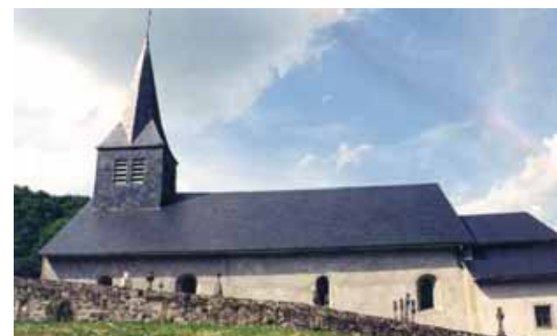
Paroisse de Blanot