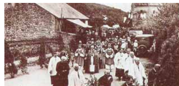
Procession en l'honneur du miracle

A u XIV e siècle à Blanot, petit village du centre de la France du diocèse d'Autun, l'évêque Pierre Bertrand fit faire une enquête canonique par son officier de curie, Jean Jarossier, l'année même pendant laquelle eut lieu le miracle. C'est ainsi qu'on dispose aujourd'hui d'un rapport détaillé des faits.