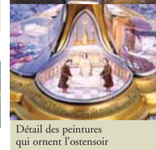
Détail des peintures qui ornent l'ostensoir