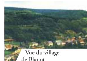
Vue du village de Blanot