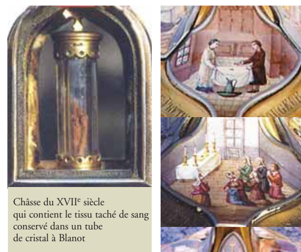
Châsse du XVII e siècle qui contient le tissu taché de sang conservé dans un tube de cristal à Blanot