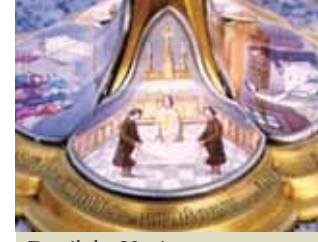
Detail der Verzierungen der Monstranz