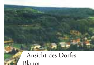
Ansicht des Dorfes Blanot