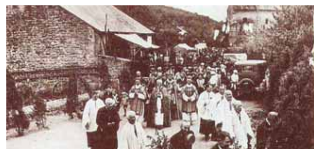
Prozession zu Ehren des Wunders