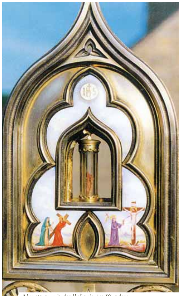
Monstranz mit der Reliquie des Wunders

Während der Ostermesse des Jahres 1331 in Blanot ließ ein Priester versehentlich ein Hostienstück auf die Altardecke fallen. Der Pfarrer versuchte sofort das Stück aufzulesen, doch dies war nicht möglich, weil es sich in Blut verwandelt und einen großen Fleck auf der Decke hinterlassen hatte. Noch heute wird die blutbefleckte Decke im Dorf Blanot in einem Reliquiar aufbewahrt.