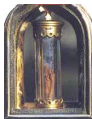
Monstranz mit der Kristallurne, welche das Wunder enthält