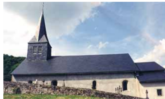
Kirche von Blanot