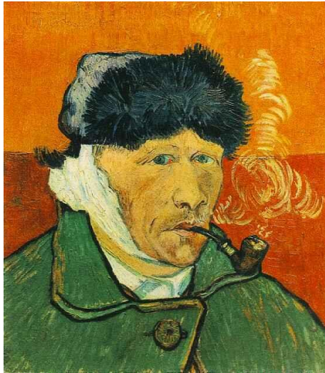
Léo Ferré - La Folie

« Toutes les infos sur le site de la Coordination Nationale »