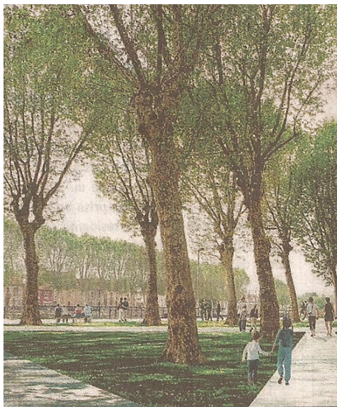
en projet, des jardins quai Turgot

Nous constatons une prise de conscience de la nécessité de changer les comportements ; d'arrêter le tout-voiture et de partager harmonieusement les espaces de vie. Pouvoir faire ses courses, aller se promener ... à pied ou à bicyclette en toute sécurité.