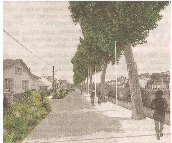
Les projets des architectes urbanistes : des espaces pour les piétons et les vélos

Aujourd'hui les « berges du cher vont sortir de terre », et au-delà des projets ou tous les modes de déplacements seront pris en compte et organisés de manière cohérente, ce que nous demandions depuis 20 ans.