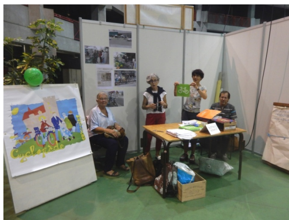
Le stand de Cyclopède à Athanor

Et aussi le souhait d'interventions plus efficaces des forces de police pour les trop nombreuses infractions impunies.