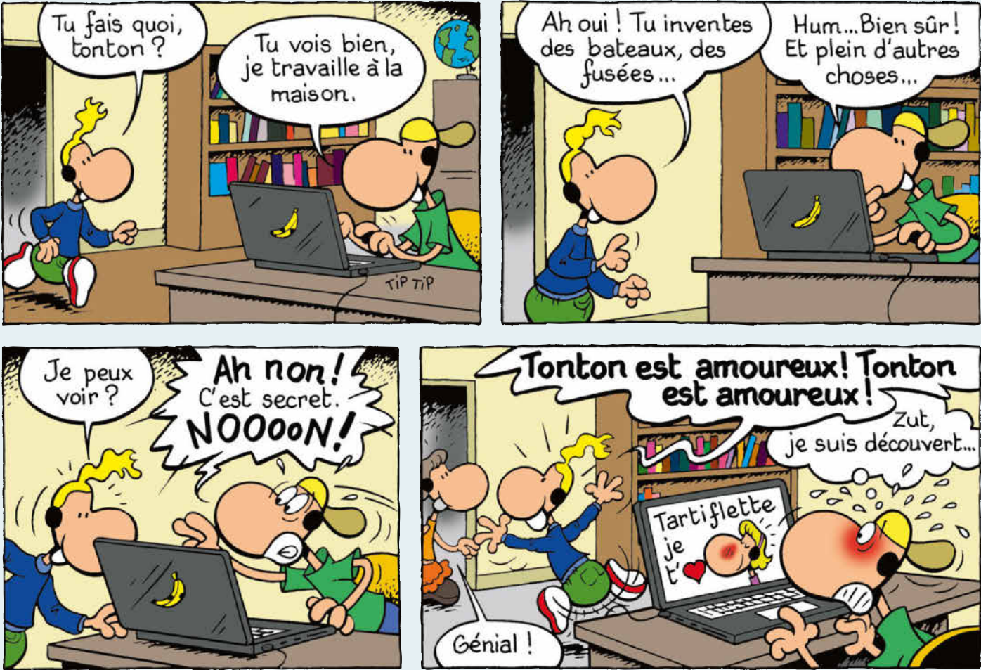
Texte et dessin : Gilbert Macé