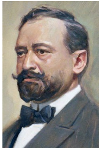
VICENTE BLASCO IBANEZ a lato «Il molino a vento e altre prose»

MENTONE (som) Forse non tutti sanno che il prolifico scrittore spagnolo Vicente Blasco Ibanez , nato a Valencia nel 1867, visse e morì a Mentone il 28 gennaio 1928. Amava la Costa Azzurra, e soprattutto il mare (frequentava anche Genova e la Liguria). E' stato sceneggiatore, molto conosciuto anche fuori dal suo paese, autore di romanzi e novelle. Fu autore anche di sceneggiature cinematografiche (come nel caso del film "Oltre ogni limite") e, talvolta, regista egli stesso. In particolare è ricordato, oltre che per la sua condizione di esule a causa delle sue idee politiche, per essere l'autore di romanzi best-seller come "Sangue e arena" e "I quattro cavalieri dell'Apocalisse": dal primo fu tratto nel 1922 il film omonimo, del quale verrà girato nel 1941 un remake con lo stesso titolo, dal secondo, riguardante l'Argentina e la prima guerra mondiale, venne realizzato nel 1921 il celebre