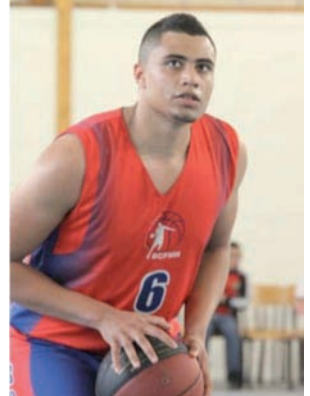
Les U20M du BCFMM Champions d'Ile-de-France

Enfin, comme chaque année, le BCFMM sera heureux de vous retrouver lors des forums des associations des trois communes : le samedi 5 septembre à Mériel et Frépillon puis le dimanche 6 septembre à Méry.