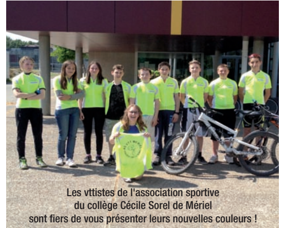
Les vttistes de l'association sportive du collège Cécile Sorel de Mériel sont fiers de vous présenter leurs nouvelles couleurs !