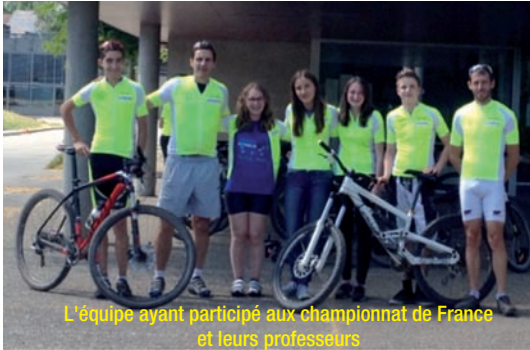
L'équipe ayant participé aux championnats de France et leurs professeurs

Félicitations à l'ensemble des coureurs et bonne continuation à 4 d'entre eux qui nous quittent pour de nouvelles aventures au lycée.