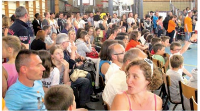
Le public avant la finale Séniors Garçons de Coupe du Val d'Oise le samedi 6 juin 2015

Un gymnase plein pendant deux jours avec un record d'affluence pour la finale Séniors Garçons le samedi soir.