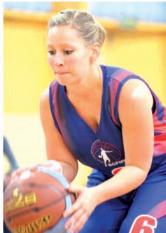
Les Séniors Filles sont Championnes du Val d'Oise

Le BCFMM a une nouvelle fois démontré ses talents d'organisateur mais également de participant puisque qu'il est parvenu à conquérir deux des trophées mis en jeu.