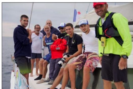
Une équipe de sept personnes, notamment composée d'un kiné, de deux skippers et de plusieurs kayakistes, l'a suivi à bord d'un catamaran durant toute la traversée.