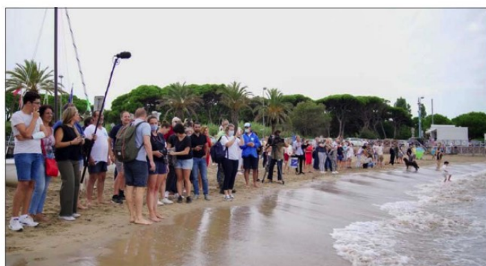
Environ 150 à 200 personnes étaient là pour accueillir le sportif, véritable ambassadeur du handisport en Corse.

« C'est mon quatorzième défi, je pense avoir fait le tour, expliquait-il juste avant son départ. Je voulais revenir à Mandelieu, là où j'ai perdu mes deux bras à la suite d'un accident électrique, là où ma nouvelle vie a commencé. Malgré un accident et des handicaps, des choses restent possibles. Mais la préparation de défis oblige à chercher des partenaires, cela prend beaucoup de temps. J'ai envie de faire autre chose, par exemple donner des conférences pour parler de mon vécu. Mais