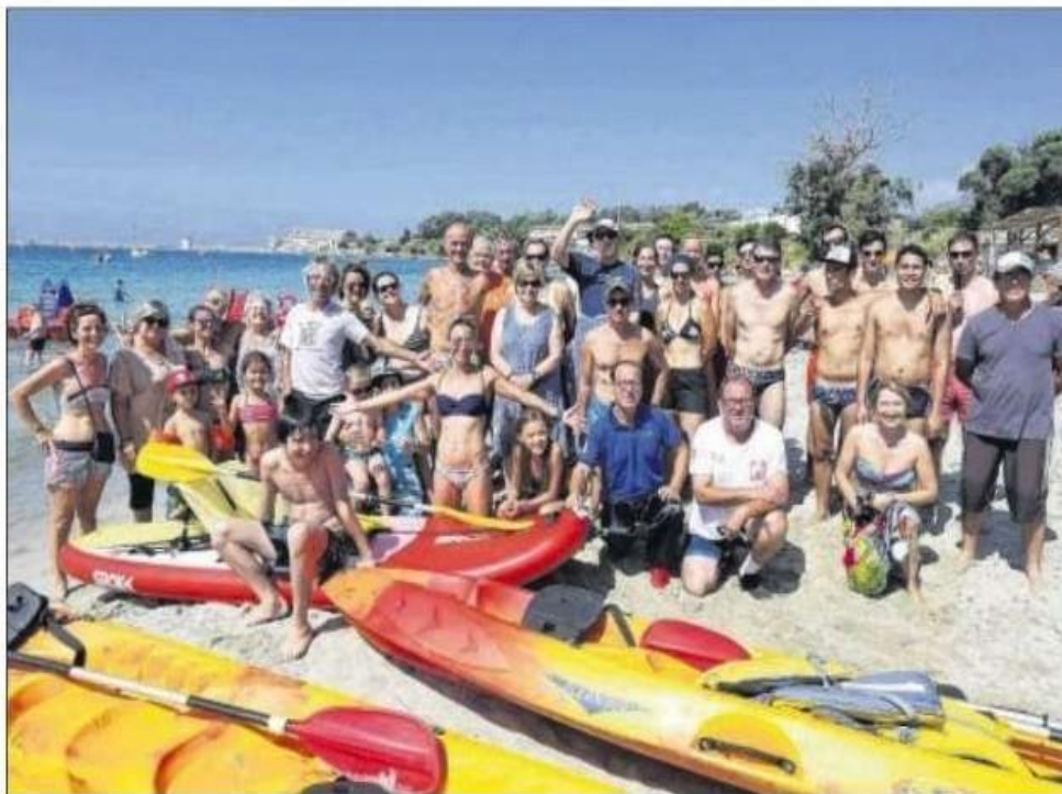
Ils étaient une cinquantaine à participer, hier matin, à la première édition "d'Ensemble sur l'eau, avec ou sans handicap".