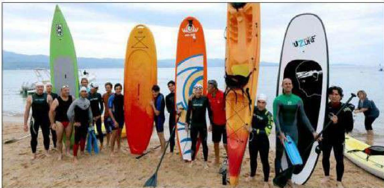
Sept équipes pratiquant nage, kayak et paddle ont participé à l'épreuve entre les plages Trottet et Saint-François.