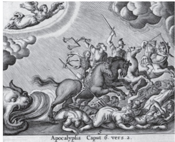
Iconographie pour l'Apocalypse

La collection compte également de nombreuses éditions des Psaumes de David mis en vers français par Clément Marot et Théodore de Bèze, le « Prayerbook » des réformés français pendant deux siècles.