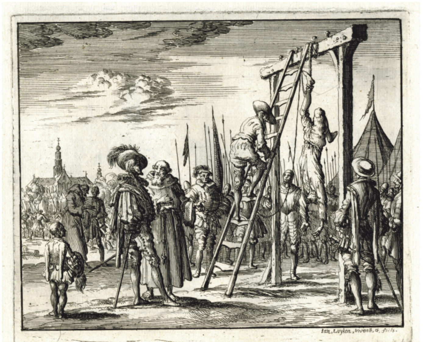
Martyr protestant, dans Tooneel der Evangelijze Bloedgetuygen, in meer dan Hondert Print-Tafereelen ; afgemaald en in't koper gebragt, door Jan Luyken [Andre 1037]