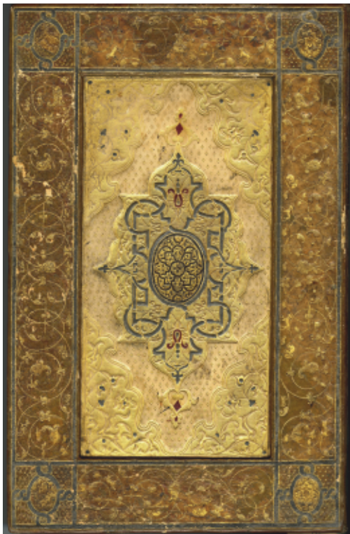
Reliure à caisson dorée et peinte