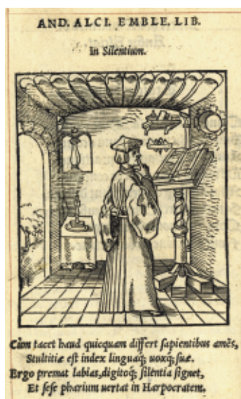
Emblèmes d'Alciat (André 1038)

De même les œuvres de poètes français réformés, ou en rapport avec eux, dans la seconde moitié du 16e siècle : Ronsard, Desportes, Du Bartas, La Noue, Valagre, Pybrac, À signaler aussi des livres illustrés de gravures : les livres d'emblèmes d'Alciat, l'inventeur de ce nouveau genre, et de la poétesse réformée Georgette de Montenay ; les danses macabres, pour lesquelles Alfred André fasciné, a fait exécuter des reliures macabres.