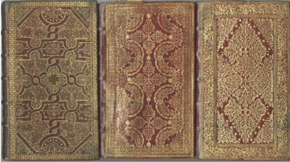
Reliures à la fanfare et filigranées d'époque