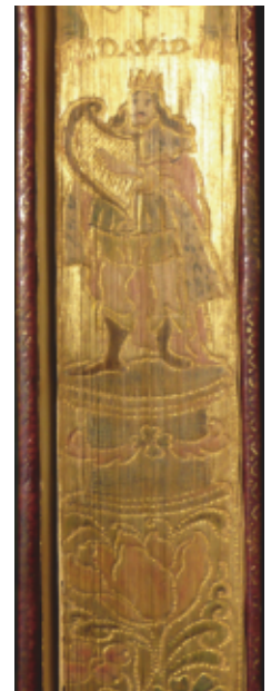
Tranches ciselées et peintes