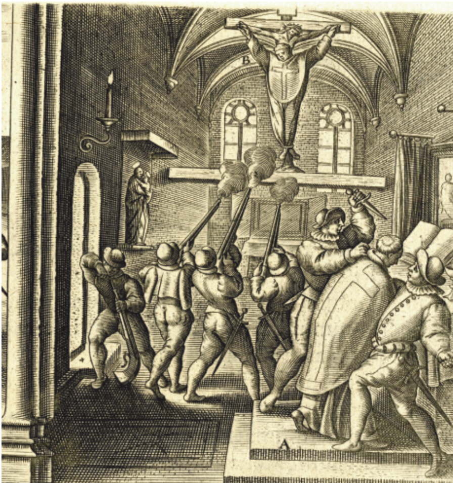
Martyr catholique dans Theatrum crudelitatum haereticorum nostri temporis, de Richard Verstegan [Andre 1002]