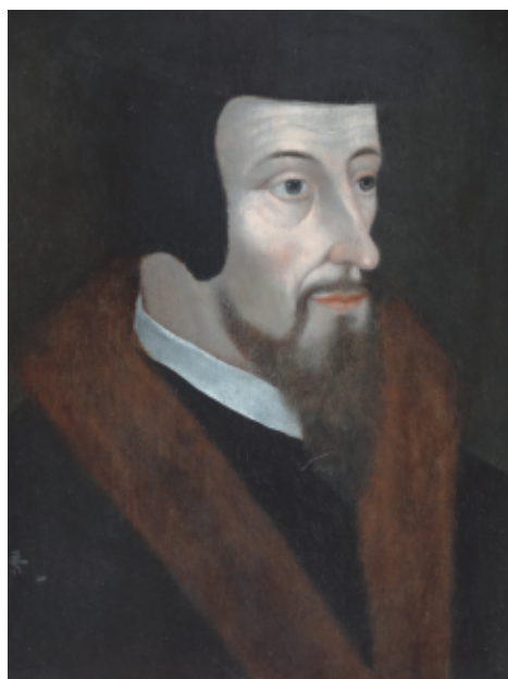
Portrait de Jean Calvin. Huile sur bois, 16e s. (Collection particulière, en dépôt à la SHPF)

Les œuvres des réformateurs francophones, publiées à Genève à partir de 1541, mieux conservées, se retrouvent en nombre dans la collection André : ainsi 87 éditions de Calvin, en latin, français, mais aussi dans des traductions anglaises, italiennes, espagnoles; 37 de Pierre Viret; 36 de Théodore de Bèze.