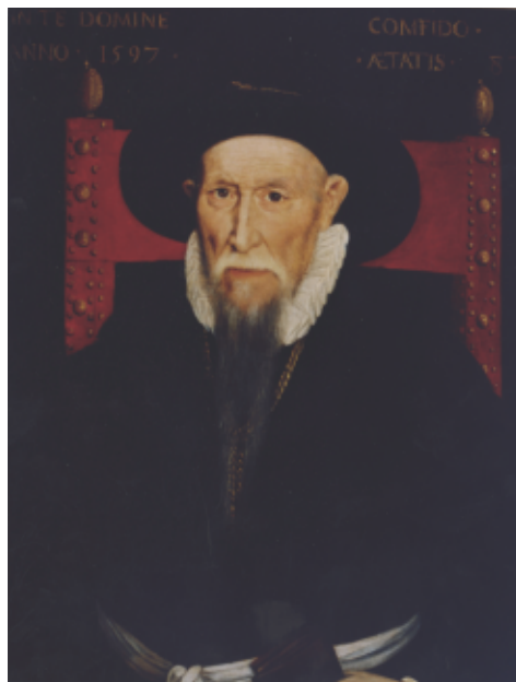
Portrait de Théodore de Bèze. Huile sur bois, 1597

De même les œuvres de poètes français réformés, ou en rapport avec eux, dans la seconde moitié du 16e siècle : Ronsard, Desportes, Du Bartas, La Noue, Valagre, Pybrac, À signaler aussi des livres illustrés de gravures : les livres d'emblèmes d'Alciat, l'inventeur de ce nouveau genre, et de la poétesse réformée Georgette de Montenay ; les danses macabres, pour lesquelles Alfred André fasciné, a fait exécuter des reliures macabres.