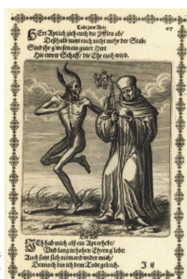
Danse et reliures macabres