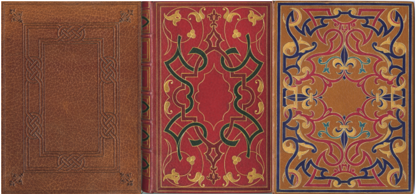
Reliure de Gruel