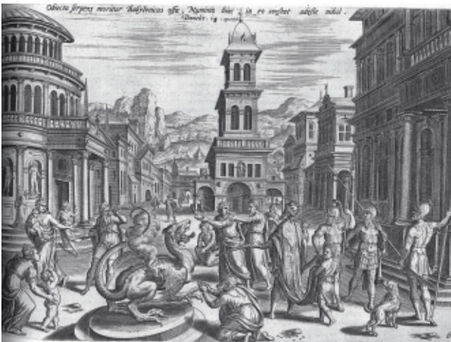
Iconographie pour le Livre de Daniel

À noter plusieurs bibles historiques, et des recueils de planches d'illustrations pour l'Ancien et le Nouveau Testament.