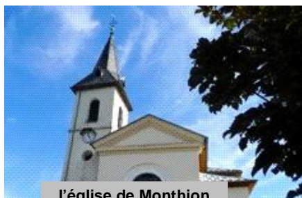
l'église de Monthion

Départ 9h00, nous prenons la rue qui monte vers le haut du village. Au poteau