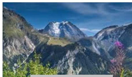
la Grande Casse

Faisant l'impasse sur la sieste traditionnelle qui eut été inconfortable avec la neige et la fraîcheur, nous prenons le