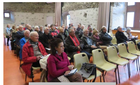
Une assemblée attentive