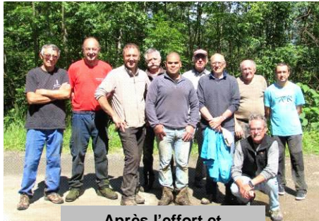
Après l'effort et avant le réconfort