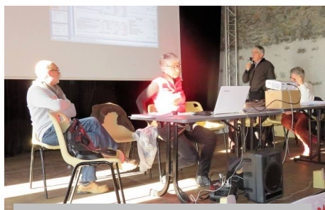
Le bureau sur le devant de la scène

Il souligne également l'importance du ® devant être apposé après la mention GR® ou GR® de Pays. Ce sigle indique qu'il s'agit d'une marque nationale déposée par la