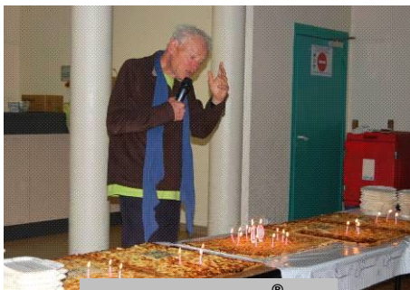
50 ans des GR®

Enfin le « farçon savoyard » vient réchauffer nos estomacs.