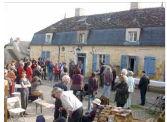
Discours, vernissage exposition printemps 2014