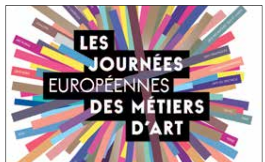
JEMA, 28-29 mars 2015

Association de Potiers Créateurs Puisaye Le Couvent - 89520 TREIGNY lecouventdetreigny89@orange.fr, 03 86 74 75 38 GPS : latitude 47.55 / longitude 3.1833