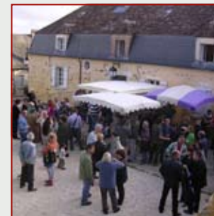
Partenariat avec le B.I.V.C., exposition d'automne 2008, « 1001 bouteilles ».

Nous vous proposons également une visite guidée de nos expositions, des offres promotionnelles pour nos stages et ateliers, enfants ou adultes.