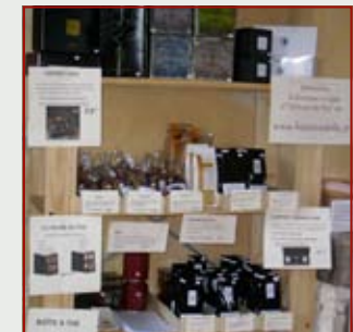
Partenariat avec « Histoire de thé », exposition d'automne 2009, « A l'heure des thés ».