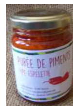
Purée de Piment