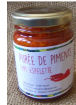
Purée de Piment