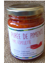
Purée de Piment