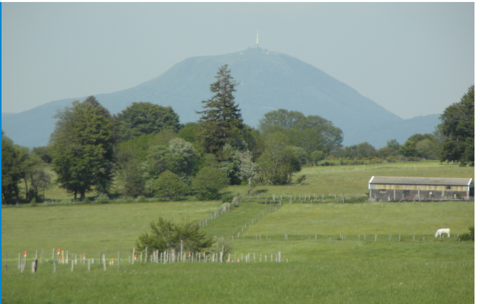
Le Puy de Dôme depuis le Plateau de Laqueuille

Il est possible d'accéder facilement au sommet par une courte randonnée qui fait l'objet d'une fiche sur le blog.