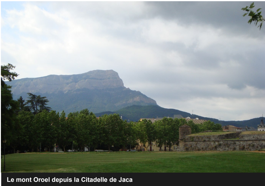
Le mont Oroel depuis la Citadelle de Jaca