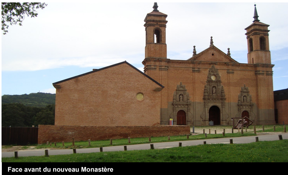
Face avant du nouveau Monastère

A Jaca, de nombreux hôtels vous attendent. Au Monastère, si vous avez les moyens.