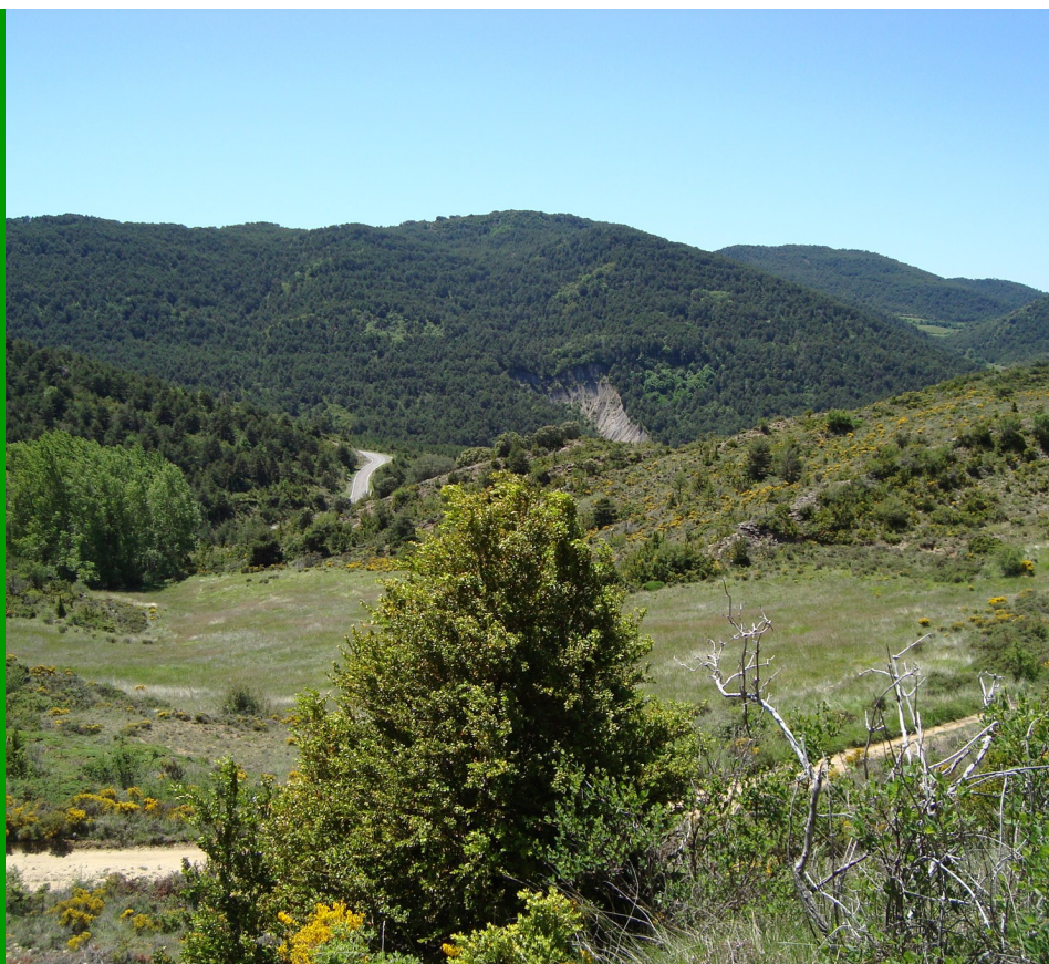
Vue du Parc, depuis un sentier de randonnée

Le Monastère est également un hôtel 4 étoiles. Le site internet donne toutes les modalités pour une réservation.