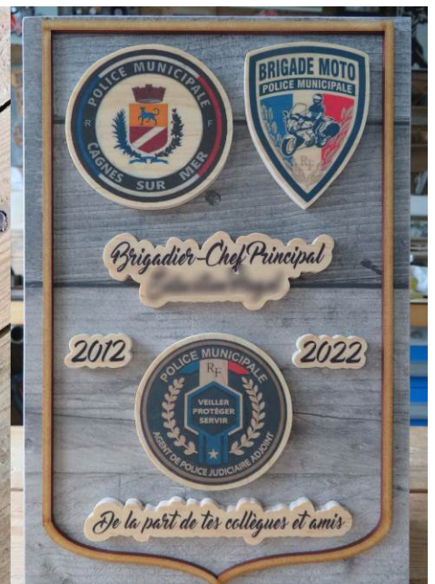
Gravure sur bois