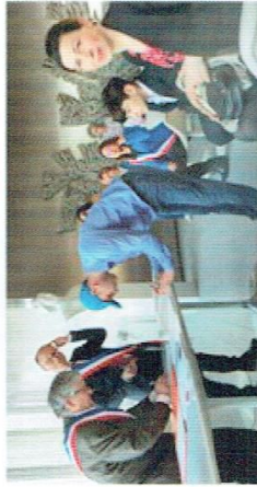
Parrainage républicain d'une famille géorgienne à la mairie de Grand-Quevilly 76

Je suis arrivé en France en 2017. A Cherbourg, j'ai intégré la communauté Emmaüs. J'ai vécu 2 ans dans cette communauté et l'Eglise m'a porté et soutenu dans les bons et les mauvais moments. A la suite d'un contrôle de la PAF (police de l'air et des frontières) j'ai eu une OQTF qui a été annulée grâce au combat et la mobilisation de tous et ceci jusqu'à l'obtention d'un titre de séjour. Aujourd'hui, j'ai suivi une formation d'aide-soignant et je travaille dans une maison de retraite.