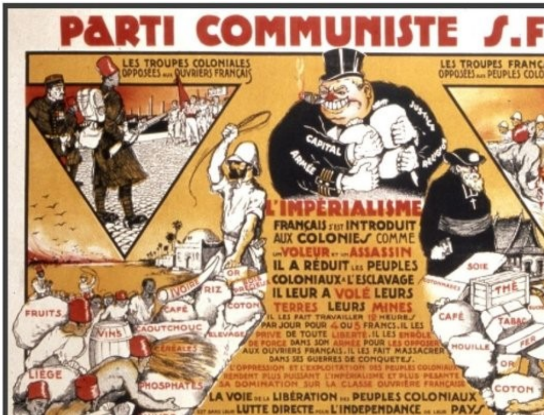
Affiche du Parti Communiste (Section Française de l'Internationale Communiste) contre le colonialisme