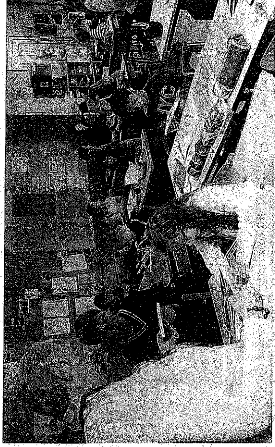
En jouant les écrivains, ils ont aussi trouvé la motivation pour devenir lecteurs.