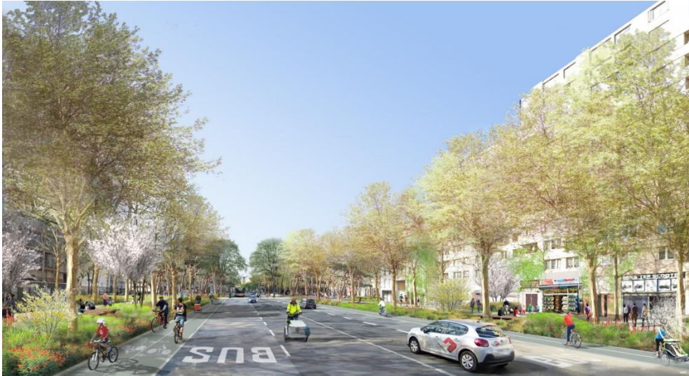
Nouvelle rue de La Chapelle - crédit : Celine Orsingher

(*) Visuel d'architecte montrant la rue de la Chapelle réhabilitée (source : dossier de presse « Porte de la Chapelle » - Anne Hidalgo/Paris en Commun - 13 janvier 2020).