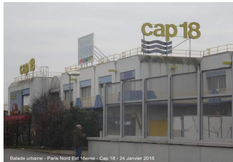
Balade urbaine - Paris Nord Est 18ème - Cap 18 - 24 Janvier 2016

C'est sur cette parcelle qu'un projet de grand espace vert de plus de 6 ha est envisagé par la Ville de Paris à l'horizon 2025. Un projet qui risque de se heurter au futur tracé de CDG Express (liaison ferroviaire rapide entre la gare de l'Est et Roissy) dont la ligne doit passer sur le terrain de Chapelle Charbon !