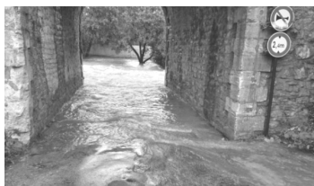
Chemin du Paratonnerre

Lors des intempéries du 10 octobre dernier, force est de constater que les travaux du programme "Cadereau" de la Ville de Nîmes engagés depuis 2007 ont évité à la ville d'être submergée. Cependant, sur les hauteurs, les quartiers de Villeverte, de Camplanier, de Vacquerolles et de la route d'Alès ont été submergés par une véritable vague déferlante qui a emporté sur son passage les revêtements routier, les clôtures des propriétés et inondé les maisons situées au long de la Route d'Alès. Dans notre quartier, les propriétés du chemin de Villeverte ont été particulièrement endommagées. Le comité de quartier de Villeverte sollicitera les services de la Mairie de Nîmes afin de tenter de régler les problèmes récurrents dans le quartier du chemin de Villeverte, du bassin de rétention de Villeverte, au carrefour de l'ancienne route d'Anduze et du chemin de Villeverte.