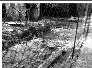
Ancienne Route D'Anduze