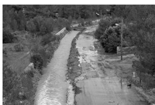
Ancienne Route d'Anduze