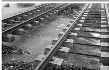
Voie ferrée au pont de Villeverte