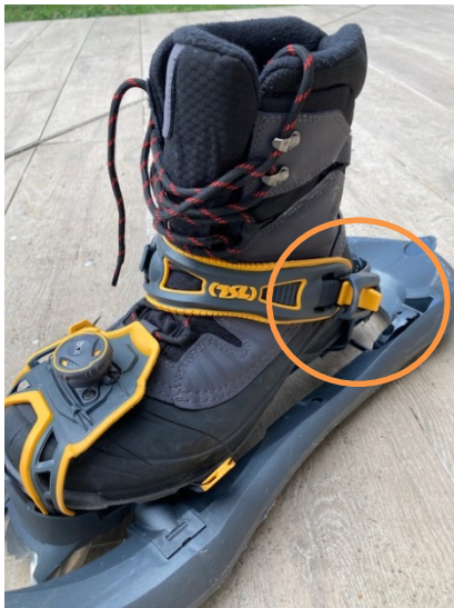
NOK – pas centré