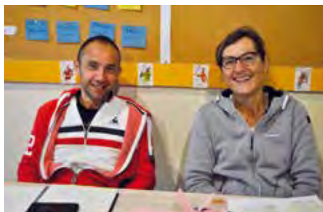
Le Président et la Trésorière

La réussite est due, à une équipe renforcée de bénévoles qui s'investit au sein du bureau et un groupe d'enseignants motivés