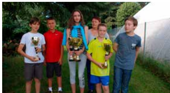
Équipes 12 ans