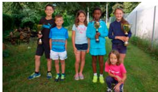
Équipes 8-10 ans