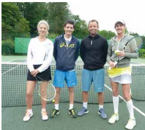
Les vainqueurs et finalistes 3 es séries.

Ce renouveau a très vite connu le succès car la formule est à la fois souple (à l'image d'un tournoi interne), accessible financièrement, et réalisée dans un esprit de convivialité. Il y a eu plusieurs phases dans les aménagements du tournoi. D'abord destiné uniquement aux adultes, l'accent a ensuite été mis progressivement sur toutes les catégories jeunes. 7 épreuves se côtoient désormais, des 11/12 ans jusqu'à une toute récente épreuve 55 ans messieurs.