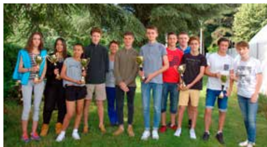
Équipes 15/16 ans