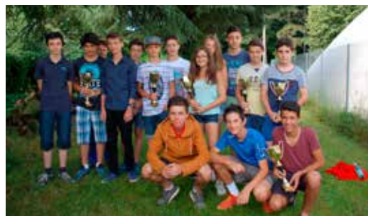
Équipes 13-14 ans