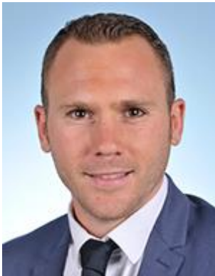
Jean Marc Zulesi , député des Bouches du Rhône

En octobre 2017, il est chargé de présider les ateliers de l'innovation dans le cadre des assises de la mobilité qui devrait déboucher sur une loi d'orientation des mobilités en 2018.