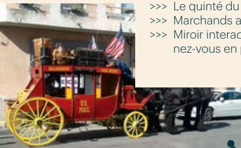
Promenade en diligence Compagnie Les légendes se racontent