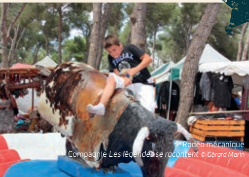
Rodéo mécanique Compagnie Les légendes se racontent © Gérard Marin