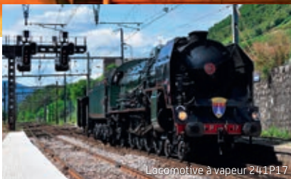
Locomotive à vapeur 241P17

Arrivée vers 10h en gare de Miramas et accueil en fanfare pour une journée inoubliable.