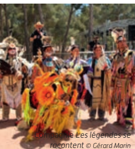
Compagnie Les légendes se racontent