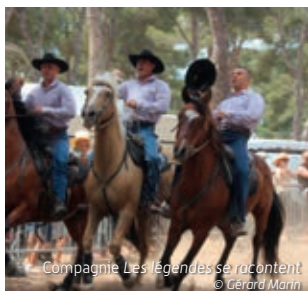
Compagnie Les légendes se racontent