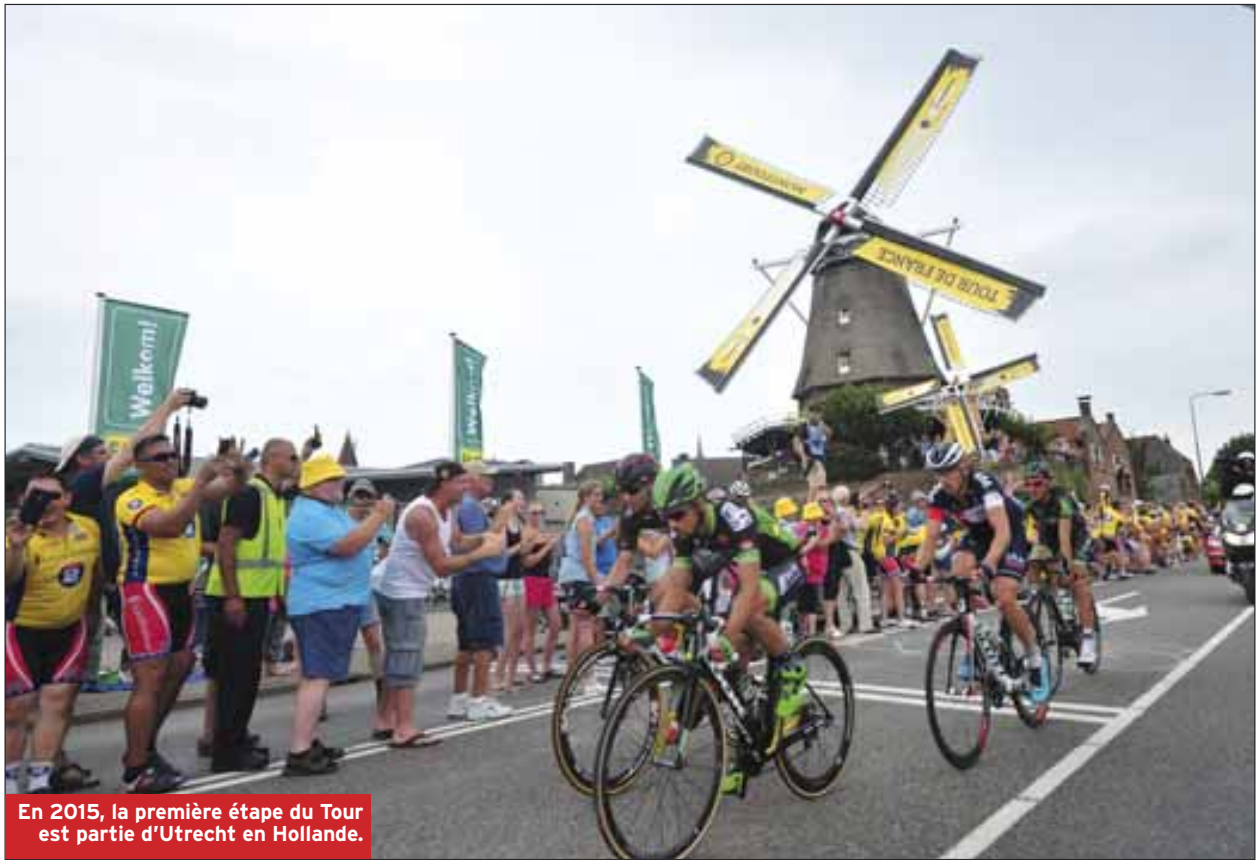
En 2015, la première étape du Tour est partie d'Utrecht en Hollande.