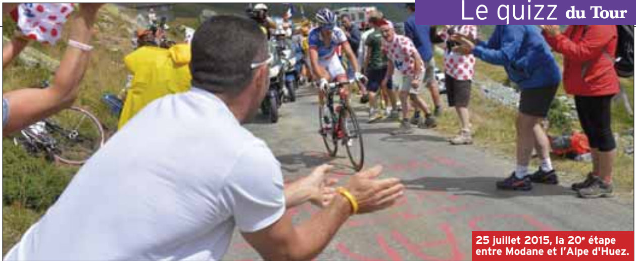
25 juillet 2015, la 20 e étape entre Modane et l'Alpe d'Huez.