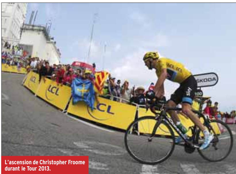
L'ascension de Christopher Froome durant le Tour 2013.

La liste des champions laissant leur nom au palmarès du mont Chauve ne cessera ensuite de s'allonger : Raymond Pouliodor en 1965, Eddy Merckx en 1970, Bernard Thévenet en 1972. Un tableau de chasse cinq étoiles. Mais le Ventoux se fera ensuite bien plus rare, avec seulement deux passages entre 1974 et 2000. Cette année-là, dans un sursaut au milieu de sa fin de carrière compliquée, Marco Pantani allait être le seul à résister jusqu'au sommet à Lance Armstrong, empêchant l'Américain de laisser son encombrant nom au palmarès de l'ascension. Deux ans plus tard, c'est l'un des plus célèbres grimpeurs français, Richard Virenque, qui s'imposait seul au prix d'une longue échappée, signant l'une de ses plus grandes victoires et sa rédemption définitive aux yeux du public français, quelques années après l'affaire Festina. Enfin, en 2013, Chris Froome, déjà revêtu du maillot jaune, se servait des pentes assassines du Ventoux pour asseoir sa victoire finale, grâce notamment à une accélération assis sur la selle restée célèbre. Et en 2016 ? ■