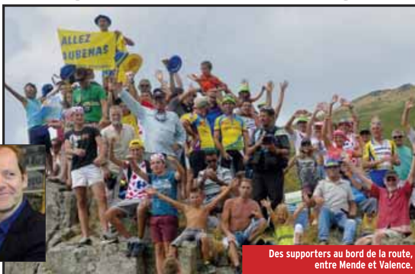
Des supporters au bord de la route, entre Mende et Valence.

Il y a beaucoup moins de « pièges » sur ce parcours que ces deux dernières années, où