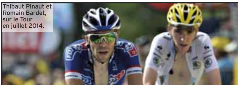
Thibaut Pinaut et Romain Bardet, sur le Tour en juillet 2014.

Et à Rio, c'est dans le cadre mythique de la plage de Copacabana que les coureurs tenteront de se parer d'or. Une arrivée en bord d'océan, mais un parcours très difficile, qui sinue dans les hauteurs de la ville : ce sont donc les puncheurs et les grimpeurs qui devraient rivaliser sur ce parcours très escarpé. Même le chrono est annoncé très ardu, et donc peu évident pour les purs spécialistes de l'effort, souvent pas très à l'aise quand la pente s'élève.