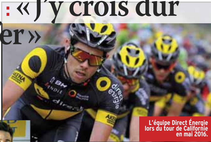
L'équipe Direct Énergie lors du tour de Californie en mai 2016.

C'est un objectif pour moi à moyen terme. Jouer les points à chaque sprint intermé-