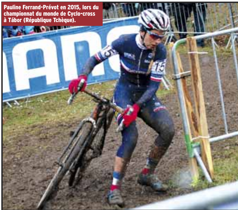
Pauline Ferrand-Prévot en 2015, lors du championnat du monde de Cyclo-cross à Tábor (République Tchèque).

qui sont ainsi associées dans un même calendrier. Le but avoué est simple : réunir les meilleures athlètes du peloton sur les meilleures courses du monde, afin d'élever le niveau général et d'obtenir une meilleure médiatisation du cyclisme féminin. Ce qui semble marcher : les télévisions sont de plus en plus intéressées par la retransmission de ces épreuves, y compris en France.