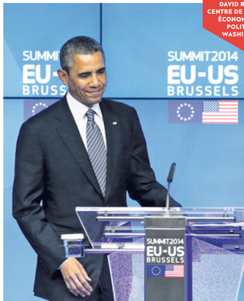
LE PRÉSIDENT AMÉRICAIN BARACK OBAMA LORS DU SOMMET ÉTATS-UNIS - UNION EUROPÉENNE, À BRUXELLES LE 26 MARS DERNIER.

La menace du « libre échange » n'est plus seulement économique mais politique. En dehors de la vue de l'opinion publique et sous l'influence des entreprises globales avec peu ou sans loyauté nationale, les négociateurs bradent nos valeurs les plus fondamentales : la démocratie représentative et le droit des citoyens de se protéger eux-mêmes. ●