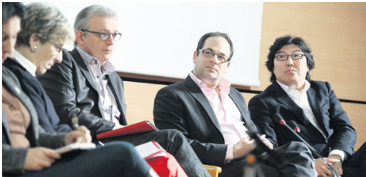
PIERRE LAURENT, SECRÉTAIRE NATIONAL DU PCF, EMMANUEL MAUREL, DE MAINTENANT LA GAUCHE, ET JEAN-VINCENT PLACÉ, D'EUROPE ÉCOLOGIE-LES VERTS, PARTISANS DU REFUS DU TRAITÉ TRANSATLANTIQUE, LORS D'UN DÉBAT EN 2013.