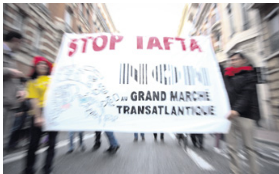
1 er MAI À TOULOUSE, LE COLLECTIF « STOP TATFA » ÉTAIT DANS LA RUE.

(1) Canada Europe Trade Agreement. Le mandat de négociation de la Commission est publié en intégralité dans le livre Grand Marché transatlantique - Dracula contre les peuples , de Patrick Le Hyaric, aux éditions de l'Humanité.