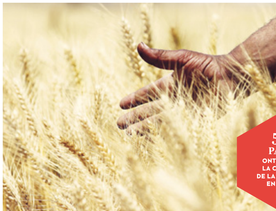
LES ALIMENTS DE BASE NE DOIVENT PAS ÊTRE TRAITÉS COMME DES MARCHANDISES.

Pourtant, au sortir de la Seconde Guerre mondiale, sous l'égide de l'Organisation des Nations unies (ONU), les représentants de cinquante-trois États (aussi divers que l'Inde, les États-Unis, la Chine, la France, le Chili, l'Iran ou Haïti), réunis à Cuba lors