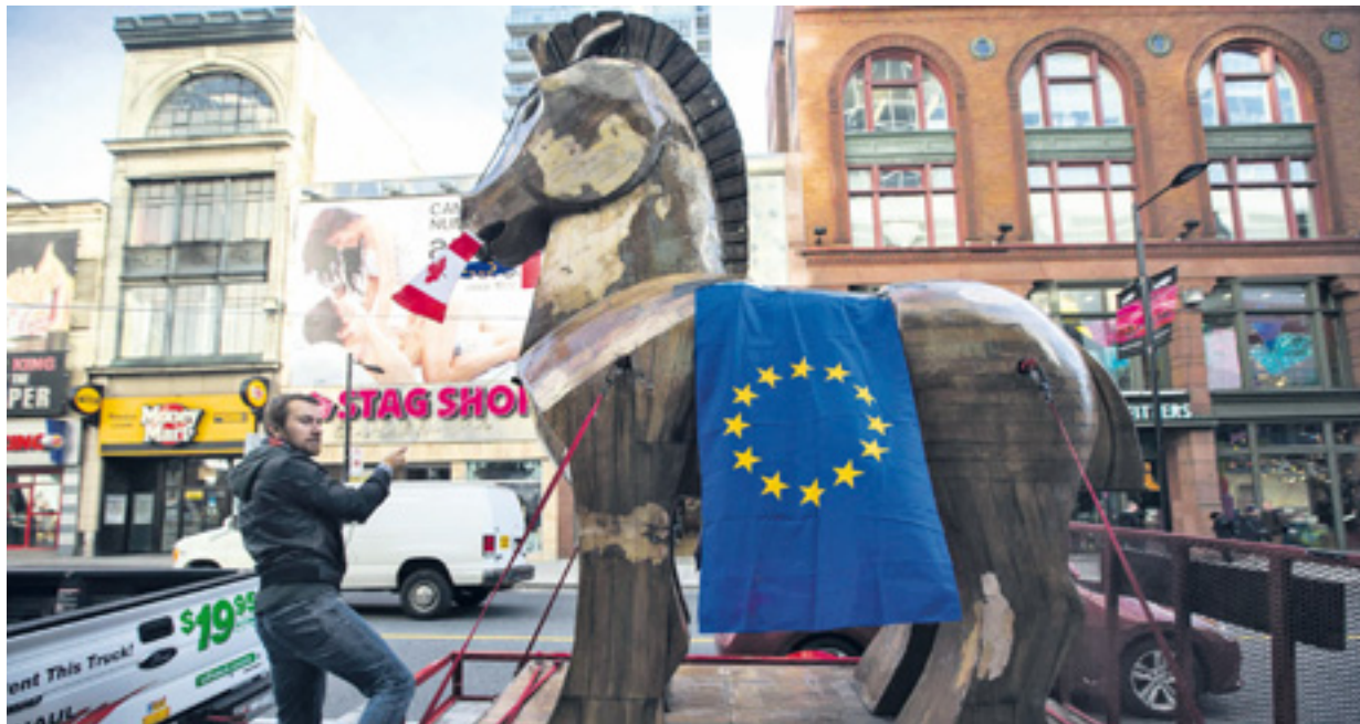
NOVEMBRE 2013. UN MILITANT PROGRESSISTE DU CONSEIL DES CANADIENS A ÉLEVÉ UN CHEVAL DE TROIE DEVANT LE CENTRE DES INVESTISSEMENTS ET DU COMMERCE, À TORONTO (ONTARIO).