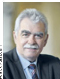
André Chassaigne Président du groupe Gauche démocrate et républicaine à l'Assemblée

Aujourd'hui, c'est un nouveau combat politique qu'il convient de mener contre un accord dicté par les intérêts des firmes multinationales - et non celle des États et de leurs peuples - et ce, conformément à la doctrine de la libéralisation du commerce mondial. Ainsi, les négociations de l'accord bilatéral sont inacceptables sur la forme comme sur le fond, car antidémocratiques et synonymes de régression pour les peuples.