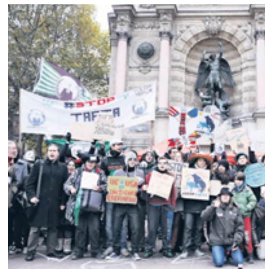
EN 2013, À PARIS, LES ANTI-TRAITÉ ENTENDAIENT BIEN ENTRER DANS LE DÉBAT.