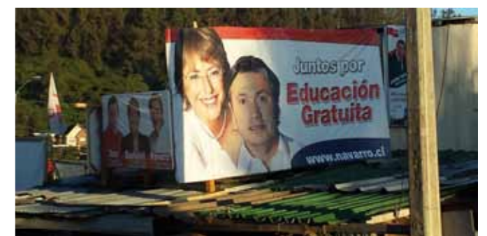
Ensemble pour une éducation gratuite. Conception (nov.2013).

Bachelet (62%) a confirmé le soutien majoritaire qu'on lui attribuait et qui lui a permis de battre la candidate de droite, Evelyn Matthei (37%), laquelle obtient le plus mauvais résultat de la droite dans une élection présidentielle depuis la fin de la dictature militaire, en 1990. Le nouveau gouvernement, qui s'installera à "La Moneda" en mars prochain, devra cependant tenir compte d'un puissant mouvement populaire avec, à sa tête, les étudiants et les lycéens qui ont mené une véritable rébellion en 2011 en réclamant notamment une éducation nationale à but non commercial et de qualité.