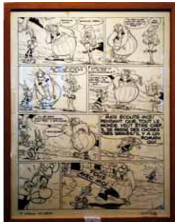
Planche originale de l'Album d'Astérix 'Le cadeau de César', de Goscinny et Uderzo