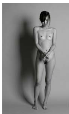
Jean-Robert Franco, Portraits-nus 18 , photographie, 180 x 140 cm.