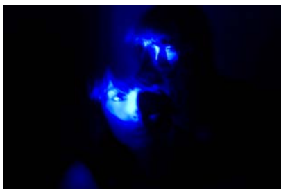
Ludovic De Vita, Screen-Out JUSTINE_01 , 2007, 60 x 40 cm.

Intimacy offre les regards de six artistes sur les rapports que l'art contemporain entretient avec le corps.