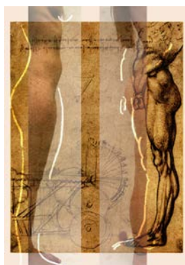
Marco Baldini, Sublime machine, 8 recto , 2012, impression numérique, 29,7 x 42 cm.

L'exposition Intimacy a été initiée en 2010 par Jean-Robert Franco. Elle a été présentée à Pékin (2010) et Chicago (2011). Elle sera à Paris du 4 au 14 juillet à la Galerie des AAB. Les artistes invités (dont la liste a évolué depuis 2010) privilégient la photographie et la vidéo, mais cette exposition reste multimédia, ouverte aux arts graphiques et à la performance, notamment musicale.