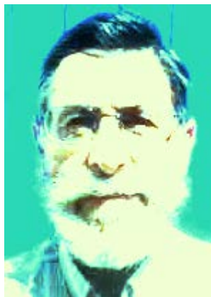
Un « précurseur, prototype de l'homme supérieur », authentique descendant de Jean Jaurès