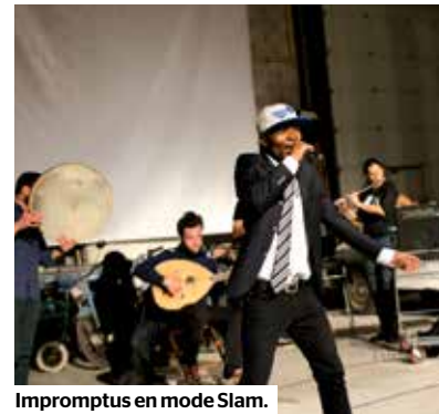
Impromptus en mode Slam.

La restitution de ce travail s'est donc joyeusement articulée autour de « documentaires sonores, happenings, tchatchades, expositions, portraits, journées d'échanges avec des chercheurs, un chariot d'écoute, un canon à lire, des ateliers, des discussions, des danses, des concerts, un carnaval, des poèmes, des slogans, des repas et, bien sûr, des apéros ! »