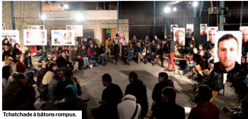
Tchatchade à bâtons rompus.

Du 18 au 21 mars, La Folle histoire de fous a réuni de nombreux acteurs sur le rapport à l'autre et la santé mentale. Le public a répondu présent, follement !