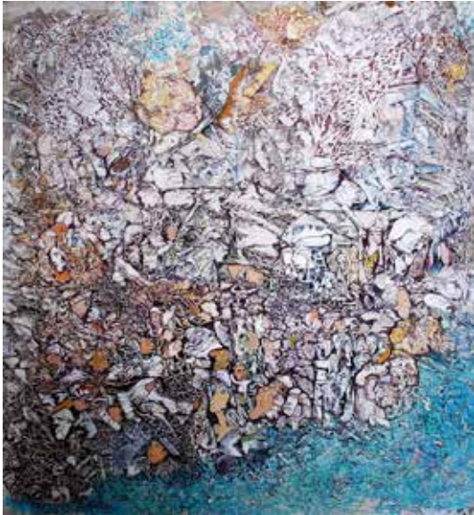
Tom Clancy chez les Goulougoulous