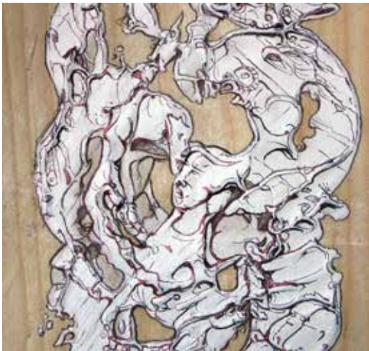
Sans titre (détail)