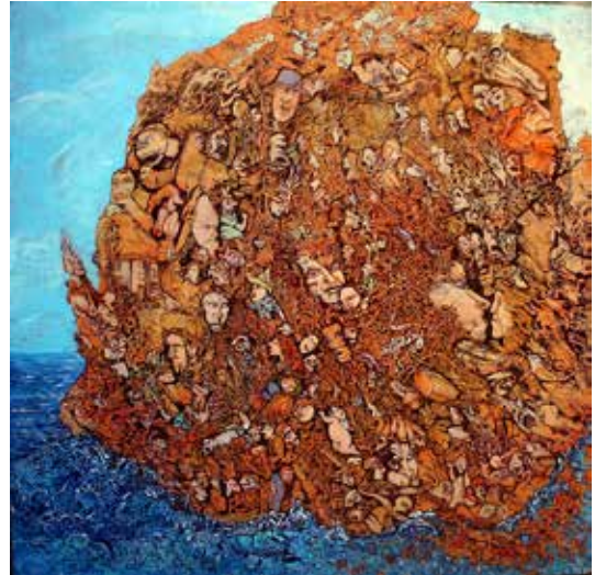
La métamorphose des supions