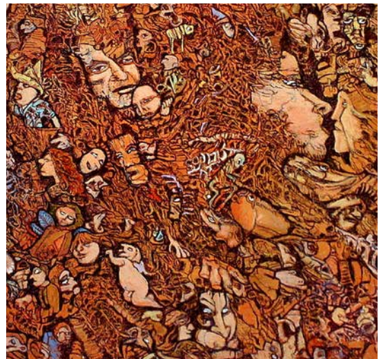
La métamorphose des supions (détail)