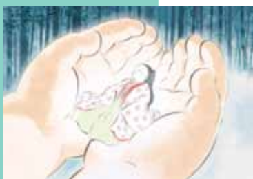
LE CONTE DE LA PRINCESSE KAGUYA