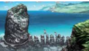
L'ILE DE GIOVANNI