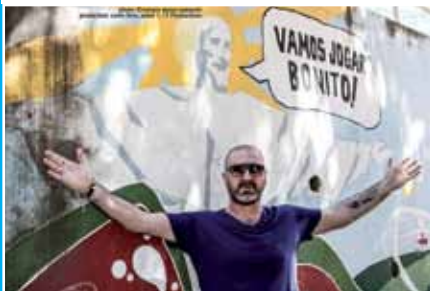
LOOKING FOR RIO