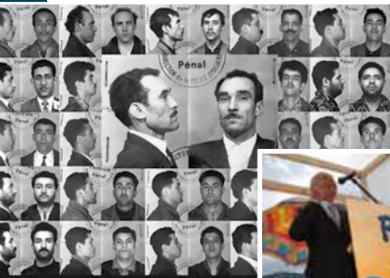
ICI ON NOIE LES ALGÉRIENS

À l'appel du Front de libération nationale (F.L.N.), des milliers d'Algériens venus de Paris et de toute la région parisienne défilent, le 17 octobre 1961, contre le couvre-feu qui leur est imposé. Cette manifestation pacifique sera très sévèrement réprimée par les forces de l'ordre. 50 ans après, la cinéaste met en lumière une vérité encore taboue. Mêlant témoignages et archives inédites, le film retrace les différentes étapes de ces événements. en partenariat avec Mémoires Vivantes , possibilité de se restaurer entre les 2 séances