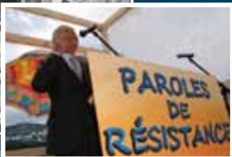
LES JOURS HEUREUX