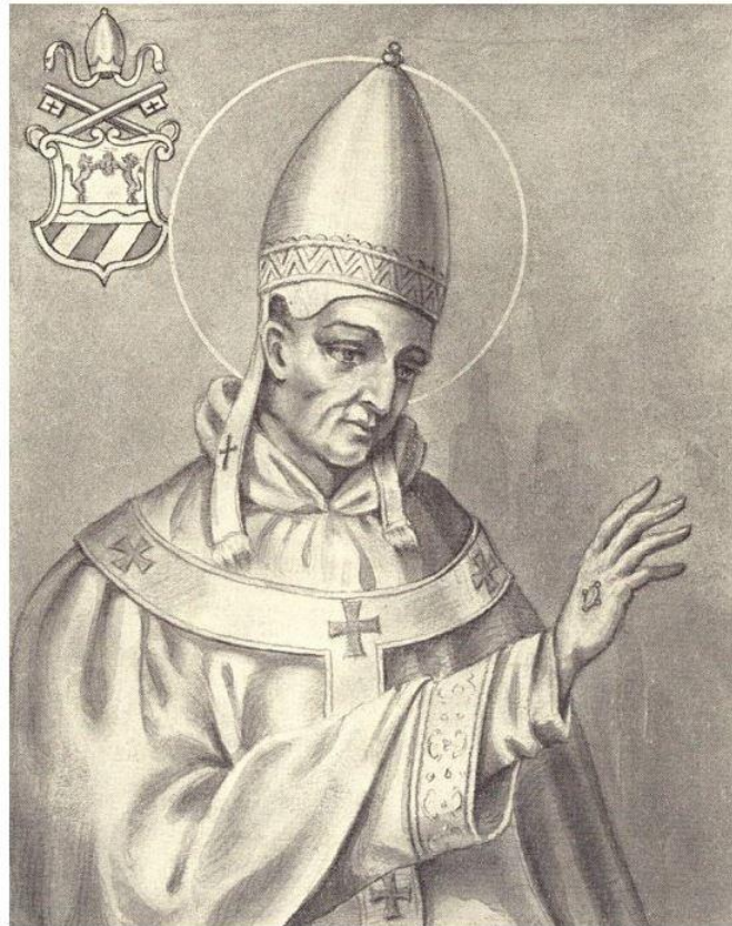
Pape Libère (352 - 366)

Attestée à Rome, sous le pontificat de l' évêque Libère (entre 352 et 366), une fête de l'incarnation du Sauveur se déroule le 25 décembre à l'occasion de laquelle l' évêque rassemble les chrétiens dans la basilique nouvellement construite au Vatican, achevée en 354, dans un cadre plus général qui apparaît comme celui de ...