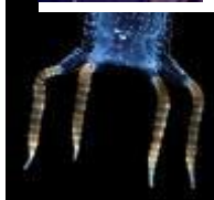
Sea Wasp from northern Australia