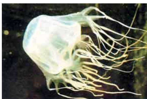
Cubozoa (Box jellyfish)

Curieux, j'ai nagé vers lui, et en tendant la main, je l'ai même saisi. Je portais mes gants, et il a passé à travers mes doigts comme une méduse. Pendant qu'il partait en flottant, je l'ai regardé d'un air perplexe, parce que c'était une méduse très bizarre . Elle avait ce qui paraissait être la tête d'un calmar, mais dont la forme était cubique, et elle avait des tentacules étranges, un peu comme des doigts. En plus, elle était transparente. Je n'avais jamais vu ce genre de méduse avant, je me suis détourné d'elle afin de continuer ma recherche de langoustes.