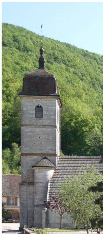
Cl. C. Vo-Ha

Une remise de 10% vous sera accordée par la boutique d'ouvrages «Point à point » sur présentation de ce document.