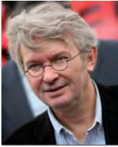
Jean Claude MAILLY Secrétaire général